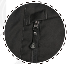
TIRADOR CON MARCA OVER MOUNTAIN