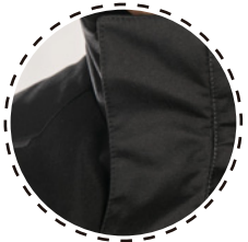
AJUSTE CENTRAL CON VELCRO